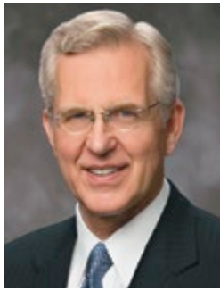
Mai vei Elder D. Todd Christofferson Ena Kuoramu ni iApositolo Le Tinikarua