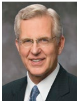
Ældste D. Todd Christofferson De Tolv Apostles Kvorum