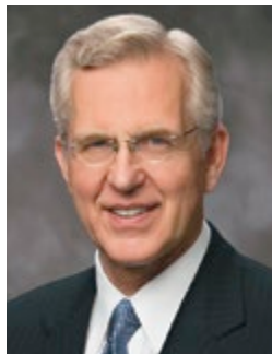
Starší D. Todd Christofferson Kvorum Dvanácti apoštolů