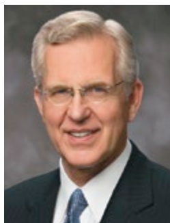
Ni Elder D. Todd Christofferson

Sa Korum sa Napulog Duha ka mga Apostoles