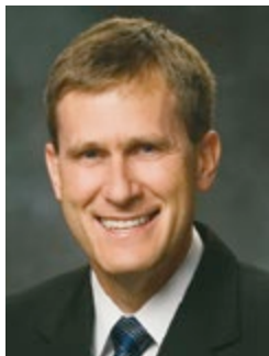
Marcos A. Aidukaiis elder a Hetvenektől