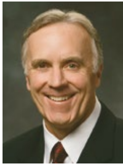
โดยเอลเดอร์ลอว์เรนซ์ อี. คอร์บริค แห่งสาวกเจ็ดสิบ

ขอให้เราเป็นทนายทแห่งพันธสัญญาและพงศ์พันธุ์ของอับราฮัมผ่านศรัทธาของเรา และโดยรับศาสนพิธีแห่งพระกิตติคุณที่ได้รับ การฟื้นฟู ข้าพเจ้าสัญญาว่าพรแห่งชีวิตนิรันดร์มีให้ทุกคนผู้มีศรัทธาและเชื่อฟัง ในพระนามของพระเยซูคริสต์ เอเมน ■