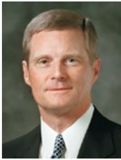
Bài của Anh Cả David A. Bednar Thuộc Nhóm Túc Số Mười Hai Vị Sứ Đồ