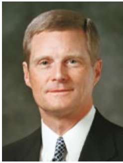
โดย เอ็ลเคอร์เควิก เอ. เบคนาร์ แห่งโควรัมอัครสาวกสิบสอง