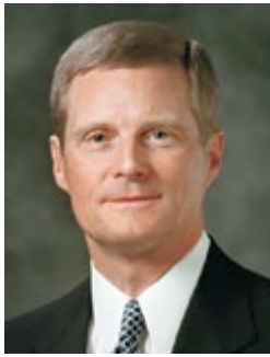
Ni Elder David A. Bednar Ng Korum ng Labindalawang Apostol