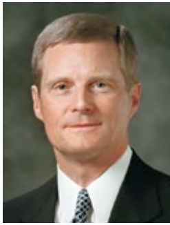
Ouderling David A. Bednar van het Quorum der Twaalf Apostelen