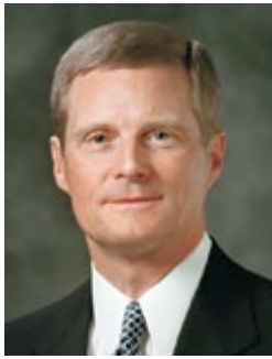
Nataon'ny Loholona David A. Bednar Ao amin'ny Kôlejin'ny Apôstôly Roambinifolo