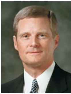
Vanhin David A. Bednar kahdentoista apostolin koorumista