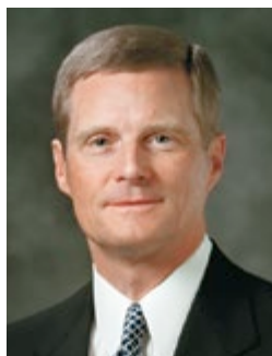
Ni Elder David A. Bednar Sa Korum sa Napulog Duha ka mga Apostoles