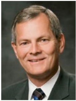
Bài của Giám Trợ Gary E. Stevenson Giám Trợ Chủ Tòa