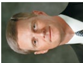
David A. Bednar