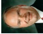
Ronald A. Rasband