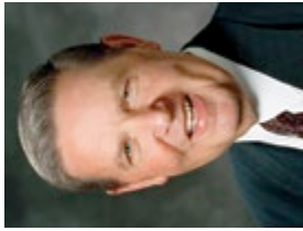
Jeffrey R. Holland