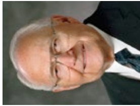
L. Tom Perry