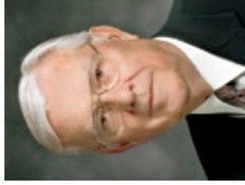
M. Russell Ballard