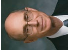
Henry B. Eyring Unang Tagapayo