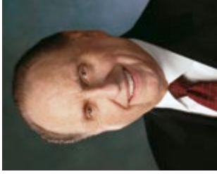
Thomas S. Monson Pangulo