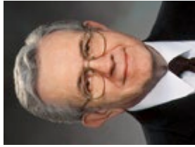
Boyd K. Packer