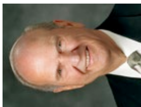
Russell M. Nelson