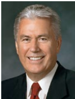
Ni Pangulong Dieter F. Uchtdorf Pangalawang Tagapayo sa Unang Panguluhan