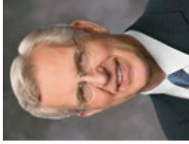
D. Todd Christofferson