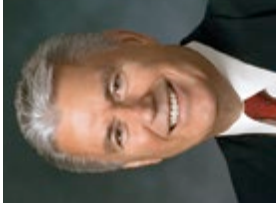
Dieter F. Uchtdorf Pangalawang Tagapayo