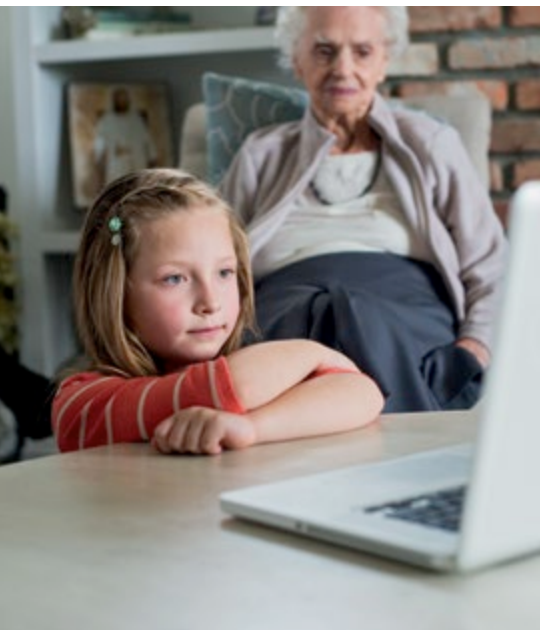
Raymond, Alberta, Canada

Kapag nagpapasalamat tayo sa Diyos sa ating mga kalagayan, makadarama tayo ng magiliw na kapayapaan sa gitna ng paghihirap. Sa kapighatian, maitataas pa rin natin ang ating mga puso sa pasasalamat. Sa mga pasakit, maaari nating luwalhatiin