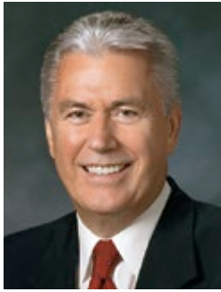
Ni Presidente Dieter F. Uchtdorf

Ikaduhang Magtatambag sa Unang Kapangulohan