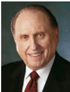
Nga Presidenti Tomas S. Monson