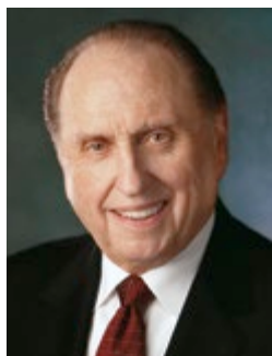
Президент Томас С. Монсон