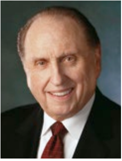
Mai vei Peresitedi Thomas S. Monson