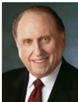
President Thomas S. Monson