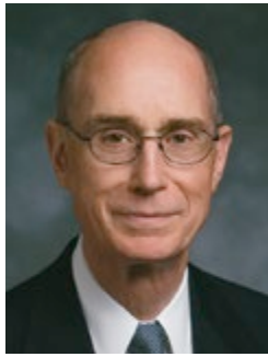
Bài của Chủ Tịch Henry B. Eyring Đệ Nhất Cố Vấn trong Đệ Nhất Chủ Tịch Đoàn