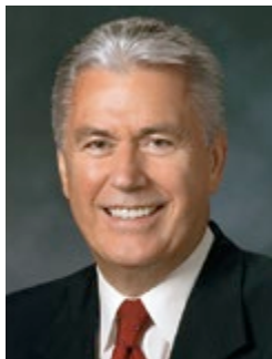
Bài của Chủ Tịch Dieter F. Uchtdorf Đệ Nhị Cố Vấn trong Đệ Nhất Chủ Tịch Đoàn

Tôi làm chứng rằng đây là Giáo Hội của Chúa. Các em đã được chọn để tham gia vào công việc của Ngài vào thời điểm này vì Ngài tin cậy rằng các em sẽ lựa chọn đúng. Các em là thể hệ chọn lọc. Trong tôn danh của Chúa Giê Su Kỵ Tô, A Men. ■