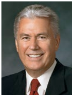
Na te peresideni Dieter F. Uchtdorf Tauturu piti i roto i te Peresideniraa Matamua

Te faa'ite papû nei au e, na te Fatu teie Ekalesia. Ua ma'itihia outou no te rave i Ta'na ohipa i teie taime no te mea te ti'aturi nei Oia ia outou no te rave i te mau ma'itiraa ti'a. E u'i ma'iti outou. Na roto i te i'oa o Iesu Mesia ra, amene. ■