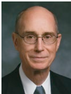
Na te peresideni Henry B. Eyring

Tauturu matamua i roto i te Peresideniraa Matamua