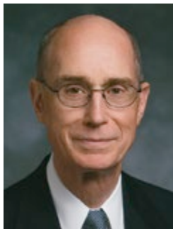
President Henry B. Eyring

förste rådgivare i första presidentskapet