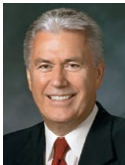
President Dieter F. Uchtdorf andre rådgivare i första presidentskapet

Jag vittnar om att det här är Herrens kyrka. Ni utvaldes att delta i hans verk just nu eftersom han litar på att ni kommer att välja rätt. Ni är valmöjligheternas släkte. I Jesu Kristi namn, amen. ■