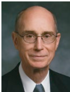
Av president Henry B. Eyring

Førsterådgiver i Det første presidentskap