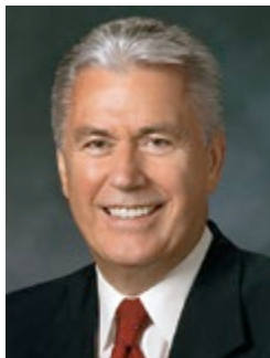
Av president Dieter F. Uchtdorf Annenrådgiver i Det første presidentskap

Jeg vitner om at dette er Herrens kirke. Dere ble utvalgt til å delta i hans arbeid på denne tid fordi han stoler på at dere tar de rette valgene. Dere er den utvalgte generasjon. I Jesu Kristi navn. Amen. ■