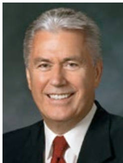
Præsident Dieter F. Uchtdorf

Jeg vidner om, at dette er Herrens kirke. I er blevet udvalgt til at deltage i hans værk på dette tidspunkt, fordi han stoler på, at I vil træffe de rigtige valg. I er generationen med valg. I Jesu Kristi navn. Amen. ■