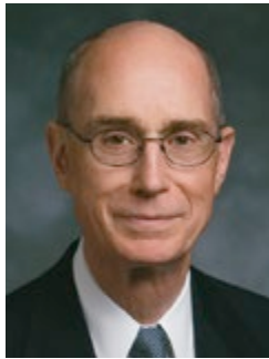
Præsident Henry B. Eyring

Førsterådgiver i Det Første Præsidentskab