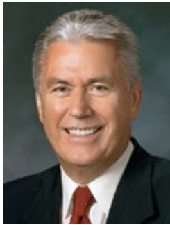
Ni Pangulong Dieter F. Uchtdorf Pangalawang Tagapayo sa Unang Panguluhan

Pinatototohanan ko na ito ang Simbahan ng Panginoon. Kayo ay piniling makibahagi sa Kanyang gawain sa panahong ito dahil tiwala Siya na pipiliin ninyo ang tama. Kayo ang piling henerasyon. Sa pangalan ni Jesucristo, amen. ■