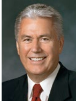
Saunia e Peresitene Dieter F. Uchtdorf Fesoasoani Lua i le Au Peresitene Sili

Ou te molimau atu o le Ekalesia lenei a le Alii. Sa filifilia outou ia auai i Lana galuega i lenei taimi ona ua Ia faatuatuaina outou e faia ia filifiliga sa'o. O outou o le tupulaga o filifiliga. I le suafa o Iesu Keriso, amene. ■