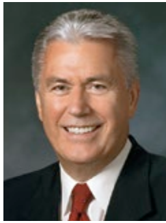
President Dieter F. Uchtdorf

Ik getuig dat dit de kerk van de Heer is. Jullie zijn uitverkoren om in deze tijd aan zijn werk deel te nemen omdat Hij erop vertrouwt dat jullie de juiste keuzes zullen doen. Jullie zijn de keuzegeneratie. In de naam van Jezus Christus. Amen. ■