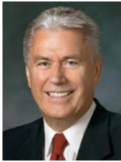
Nataon’ny Filoha Dieter F. Uchtdorf

Mijoro ho vavolombelona aho fa ity no Fiangonan’ny Tompo. Voafidy ianao handray anjara amin’ny Asany amin’izao fotoana izao satria mahatoky anao Izy fa hanao ny safidy tsara ianao. Ianareo no taranaka nofinidy. Amin’ny anaran’i Jesoa Kristy, amena. ■