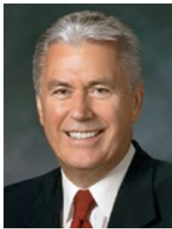
Dieter F. Uchtdorf elnök második tanácsos az Első Elnökségben

Bizonyágomat teszem arról, hogy ez az Úr egyháza. Ti lettetek kiválasztva arra, hogy ebben az időben vegyetek részt a munkájában, mert bízik bennetek, hogy helyes döntéseket hoztok. Ti vagytok a választott nemzedék. Jézus Krisztus nevében, ámen. ■