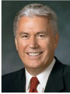
Presidentti Dieter F. Uchtdorf

Todistan, että tämä on Herran kirkko. Teidät on valittu osallistumaan Hänen työhönsä tänä aikana, koska Hän luottaa siihen, että te teette oikeita valintoja. Te olette valintojen sukupolvi. Jeesuksen Kristuksen nimessä. Amen. ■