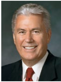
Mai vei Peresitedi Dieter F. Uchtdorf

Au vakadinadinataka ni oqo na Lotu ni Turaga. Ko ni a digitaki mo ni vakaitavi ena Nona cakacaka ena gauna oqo baleta ni nuitaki kemuni o Koya mo ni cakava na digidigi dodonu. Sa i kemuni na itabatamata digitaki. Ena yaca i Jisu Karisito, emeni. ■