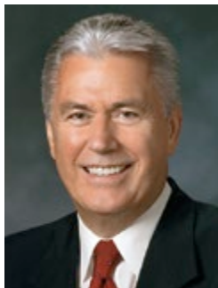
Præsident Dieter F. Uchtdorf Andenrådgiver i Det Første Præsidentskab

Jeg vidner om, at dette er Herrens kirke. I er blevet udvalgt til at deltage i hans værk på dette tidspunkt, fordi han stoler på, at I vil træffe de rigtige valg. I er generationen med valg. I Jesu Kristi navn. Amen. ■