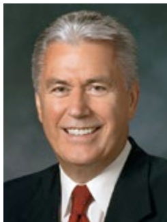
President Dieter F. Uchtdorf Druhý rádce v Prvním předsednictvu

Svědčím o tom, že toto je Pánova Církev. Byli jste vyvoleni, abyste se na Jeho díle podíleli v tuto dobu, protože vám důvěruje, že se dokážete správně rozhodovat. Jste pokolením možností. Ve jménu Ježíše Krista, amen. ■