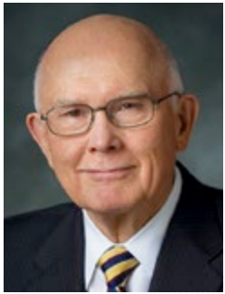
Ni Elder Dallin H. Oaks Ng Korum ng Labindalawang Apostol