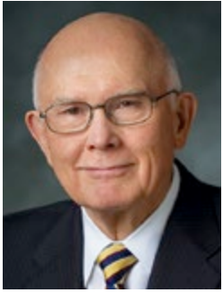
Na Elder Dallin H. Oaks

No te Pūpū no te Tino Ahuru Ma Piti Aposetolo