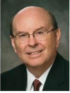
Fai 'e 'Eletā Quentin L. Cook

'O e Kōlomu 'o e Kau 'Aposetolo 'e Toko Hongofulu Mā Uá