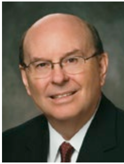
Ni Elder Quentin L. Cook Ng Korum ng Labindalawang Apostol