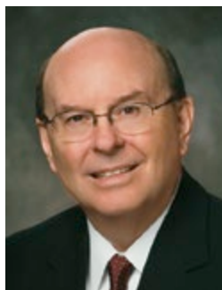
Äldste Quentin L. Cook i de tolv apostlarnas kворum