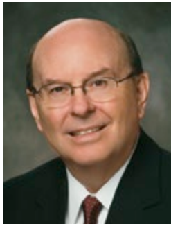
Ouderling Quentin L. Cook van het Quorum der Twaalf Apostelen