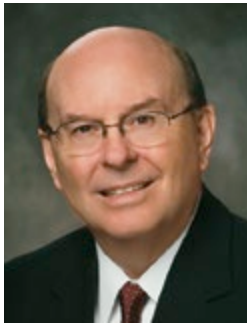
Nataon'ny Loholona Quentin L. Cook Ao amin'ny Kôlejin'ny Apôstôly Roambinifolo