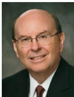
Quentin L. Cook du Collège des douze apôtres