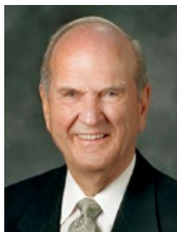
Ouderling Russell M. Nelson van het Quorum der Twaalf Apostelen