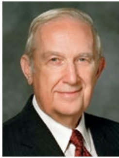
Ouderling Richard G. Scott van het Quorum der Twaalf Apostelen