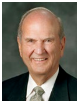
Russell M. Nelson du Collège des douze apôtres