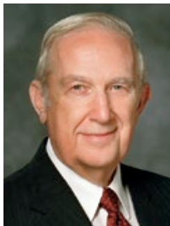
Par Richard G. Scott du Collège des douze apôtres