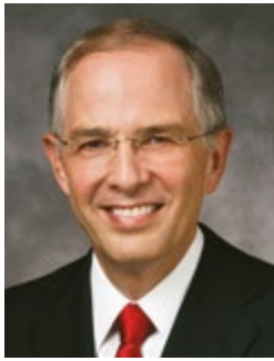
โดย เจ็ลเคอร์เนล แอล. แอนเคอร์เซ็น แห่งโคเวรัมอัครสาวกสิบสอง