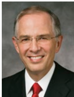
Старейшина Нейл Л. Андерсен Член Кворума Двенадцати Апостолов