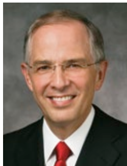
Av eldste Neil L. Andersen i De tolv apostlers quorum