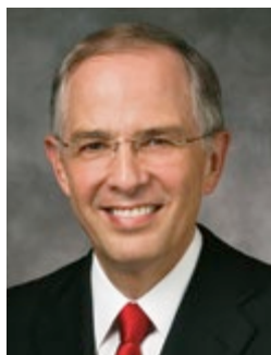
Ouderling Neil L. Andersen van het Quorum der Twaalf Apostelen