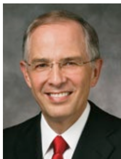
Anziano Neil L. Andersen Membro del Quorum dei Dodici Apostoli