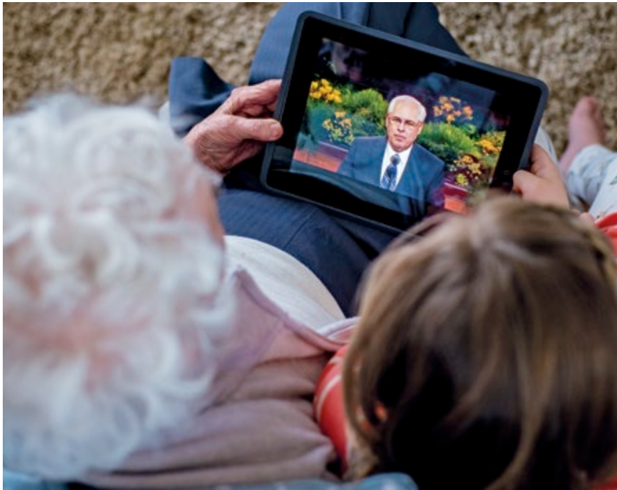
Raymond, Alberta, Canada

ating mga tahanan gamit ang mga filter at setting sa mga electronic device. Mga magulang, alam ba natin na ang mga mobile device na nakakakonekta sa Internet, hindi mga computer, ang nagdudulot ng pinakamalaking problema? 2